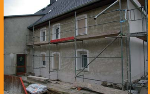
Das Gespräch mit dem Fachmann war hilfreich und so fiel die Wahl auf Genial Feuchteregulierungsputz.