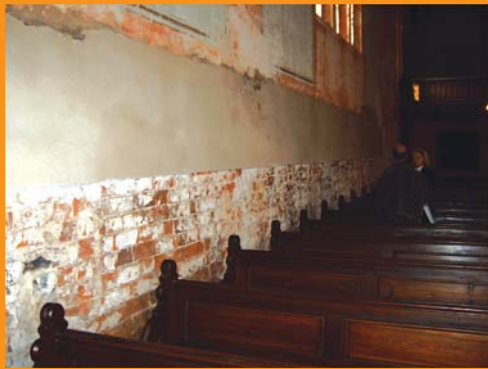
Aufsteigende Feuchtigkeit zerstört das Mauerwerk.