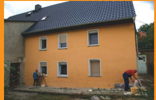
Heute zeigt sich das Haus im völlig neuen Glanz. Selbst starker Regen wird dem Putz nicht schaden.