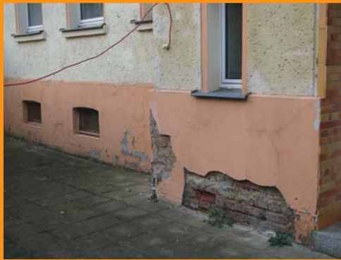
An ständig feuchten Wänden hält kein Putz.