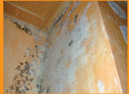
Zu viel Feuchtigkeit führt zur Schimmelbildung.

Meist sind es ältere Häuser und vor allem leider oft historische Bauwerke (z.B. Kirchen, Burgen und Schlösser), die von aufsteigender Feuchtigkeit derart stark betroffen sind, dass das Mauerwerk zerbröseln und der Putz abfällt. Die Luftfeuchtigkeit ist sehr hoch und ein unangenehmer Modergeruch breitet sich aus. Kellerräume können nicht genutzt werden.