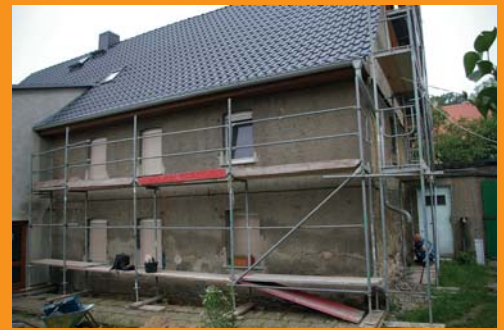
An immer mehr Stellen fiel der Putz ab. Jetzt sollte das Haus komplett neu verputzt werden.