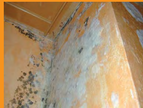
Zu viel Feuchtigkeit führt zur Schimmelbildung.

Meist sind es ältere Häuser und vor allem leider oft historische Bauwerke (z.B. Kirchen, Burgen und Schlösser), die von aufsteigender Feuchtigkeit derart stark betroffen sind, dass das Mauerwerk zerbröseln und der Putz abfällt. Die Luftfeuchtigkeit ist sehr hoch und ein unangenehmer Modergeruch breitet sich aus. Kellerräume können nicht genutzt werden.