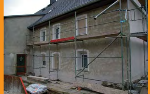
Das Gespräch mit dem Fachmann war hilfreich und so fiel die Wahl auf Genial Feuchteregulierungsputz.