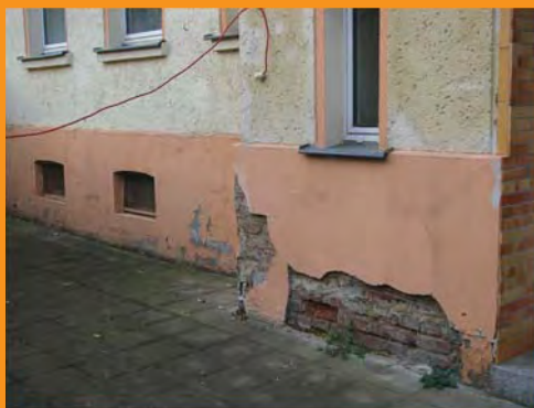
An ständig feuchten Wänden hält kein Putz.