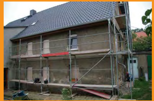
An immer mehr Stellen fiel der Putz ab. Jetzt sollte das Haus komplett neu verputzt werden.