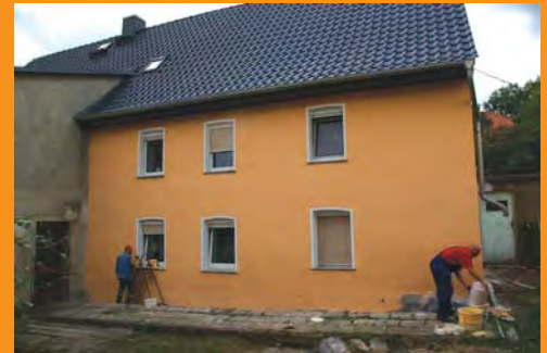
Heute zeigt sich das Haus im völlig neuen Glanz. Selbst starker Regen wird dem Putz nicht schaden.